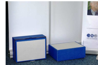
Panel auf der Rückseite mit geeigneten Gegenständen beschweren