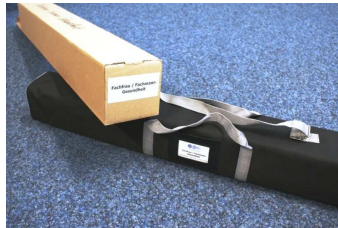
Kartin und Köchertasche Alustandfuss mit Teleskoprohr und Panel