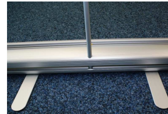
Beine ausklappen und Teleskoprohr so tief wie möglich in die Aluschiene stecken