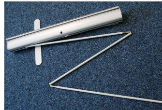
Teleskoprohr aus dem Alustandfuss herausnehmen und zusammenstecken